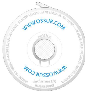
Druckknopfseite press-button side