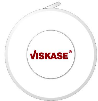
Druck Platine print center disc