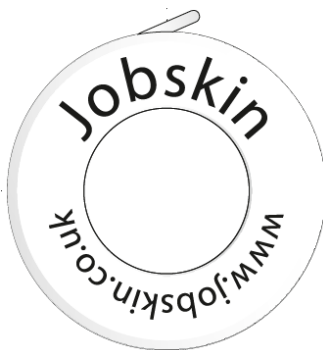
Platinenseite center disc side