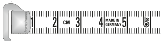
Hakenbeschlag hook attachment