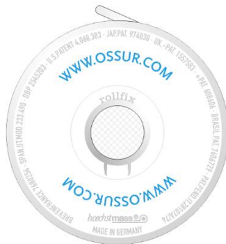
Druckknopfseite press-button side